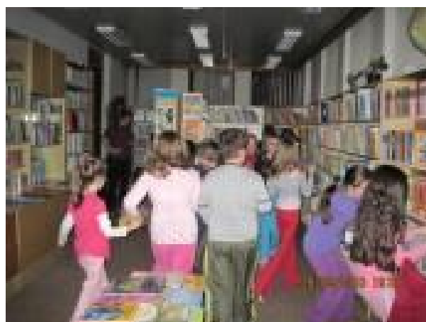
V nočnej knižnici hľadali „nocľazníci“ skryté poklady medzi knihami.