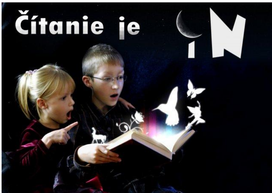
BILBORD – autor STANISLAV KOLEŠTÍK z Valaskej Dubovej