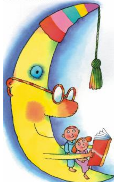
Noc s Andersenom

Registrácia knižníc je potrebná nielen kvôli štatistickým ukazovateľom, ale najmä kvôli mediálnej propagácii knižníc, v rámci ktorej SSK v komunikácii so Slovenským rozhlasom, hlavným mediálnym partnerom, alebo s televíznymi štábmi usmerňuje možné živé vstupy z knižníc a z podujatia. Každá zaregistrovaná slovenská knižnica navyše získava ešte